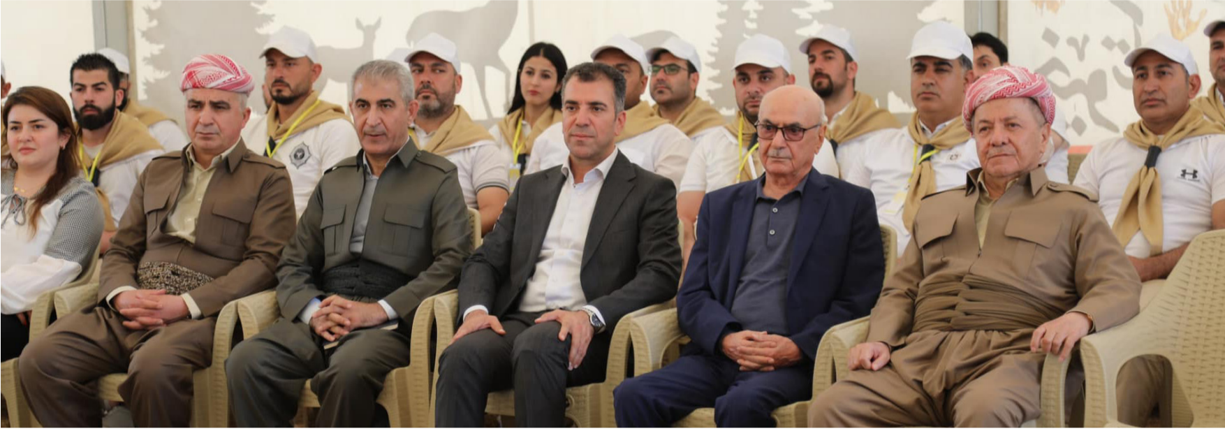
كوردستان - خاص

زار الرئيس مسعود بارزاني، يوم الثلاثاء، 30 نيسان 2024، «مخيم البارزاني - الدورة الأولى» الخاص بشباب وكوادر الحزب الديمقراطي الكوردستاني - سوريا، في منطقة بارزان، بهدف تفقّد المخيم والاطلاع على فعالياته وأنشطته عن قرب.